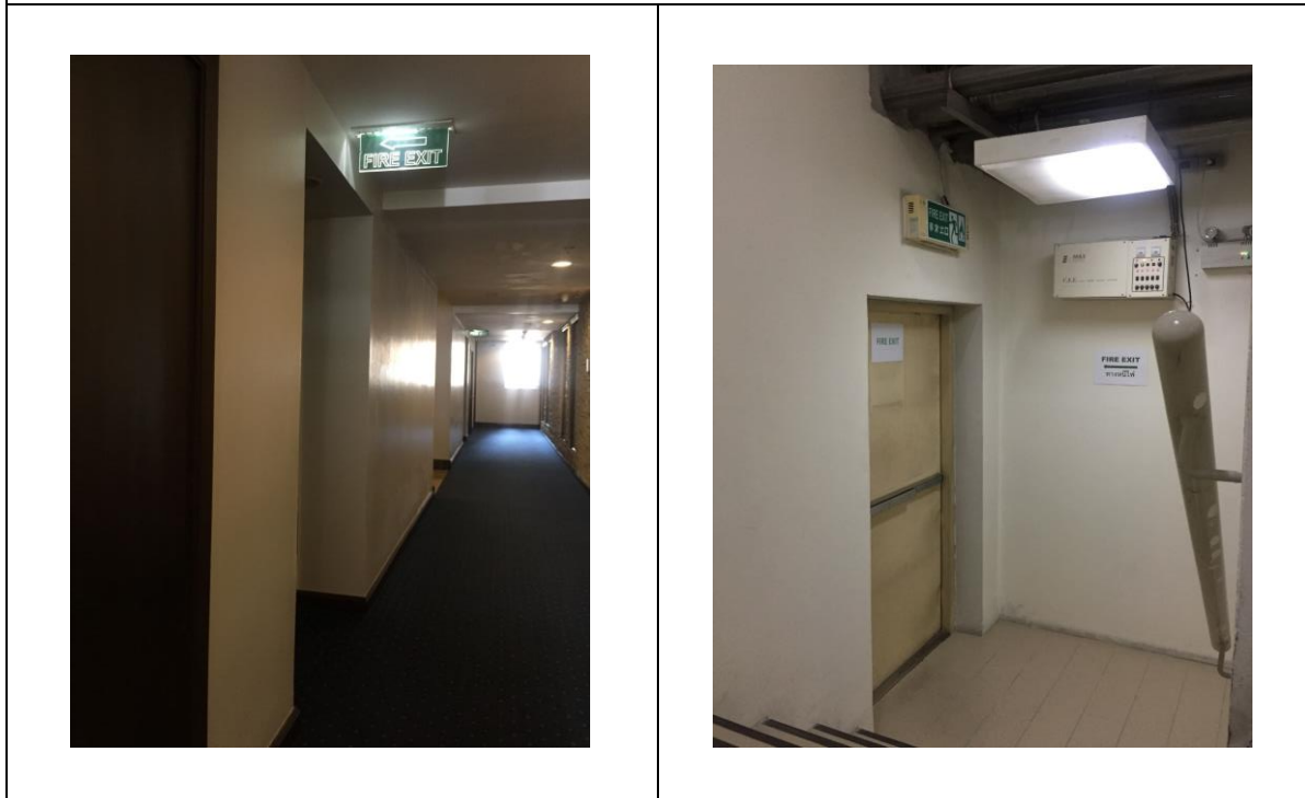
ป้ายบอกทางหนีไฟ ประตุนหนีไฟ และบันไดหนีไฟ

รูปที่ 2.4.6-1 อุปกรณ์ป้องกันอัคคีภัย อุปกรณ์แจ้งเหตุอัคคีภัย ป้ายบอกทางหนีไฟ ประตูและบันไดหนีไฟ