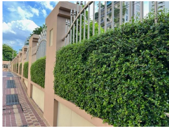
พื้นที่สีเขียวบริเวณชั้นล่าง