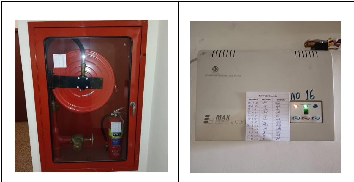
อุปกรณ์ป้องกันอัคคีภัย และอุปกรณ์แจ้งเหตุอัคคีภัย