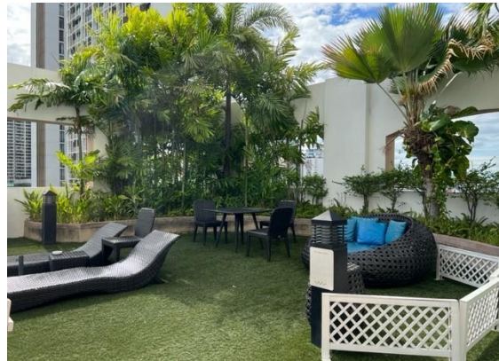
พื้นที่สีเขียวบนอาคาร

รูปที่ 2.5-1 สภาพพื้นที่สีเขียวบริเวณชั้นล่าง และพื้นที่สีเขียวบนอาคารโครงการ